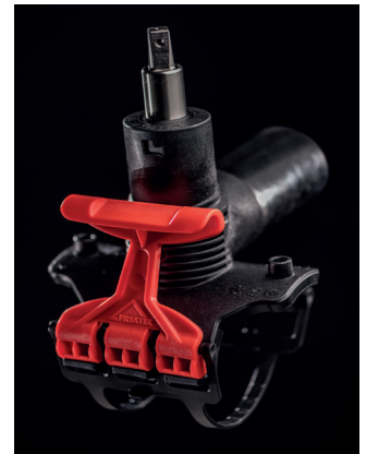
Schnell und einfach installiert: Die neue FRIALEN DAV mit extralangem Abgangsstützen und Schnellspannhebel RED SNAP.