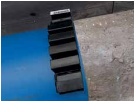
Anwendung Einzugsicherung bei Rohrsanierung.

In der Rohrsanierung. Durch Abkühlungseffekte kann sich das eingezogene PE-Rohr oder der PE-Liner in die Altleitung einziehen.