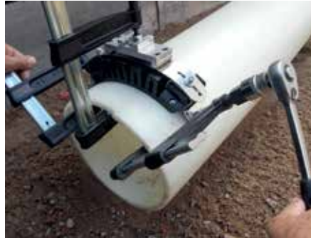
Montage mit der FRIATOOLS Aufspannvorrichtung FIXBLOC FWFB.

Mit der FRIATOOLS Aufspannvorrichtung FIXBLOC FWFB lässt sich der FIXBLOC auf PE-Rohre im Dimensionsbereich d 160 bis d 500 an der Rohrschnittkante montieren.