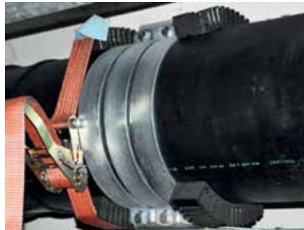
Anwendung als Festpunkt bei oberirdischer Rohrverlegung

Zur Erstellung eines Fest- bzw. Fixierpunktes.