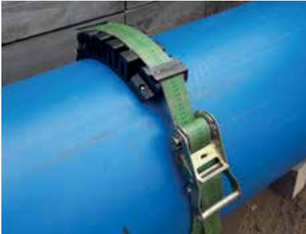
Montage mit Spanngurt.