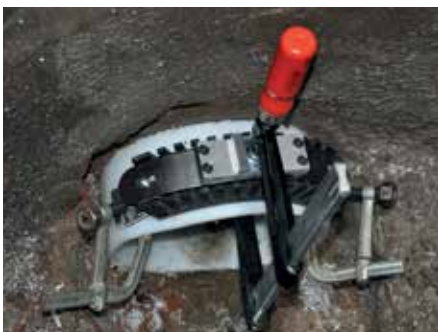
Anwendung Einzugsicherung bei einer Schachtabindung