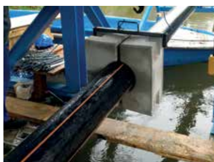
Anwendung als Fixierung für Sinkgewichte bei Seeleitungen